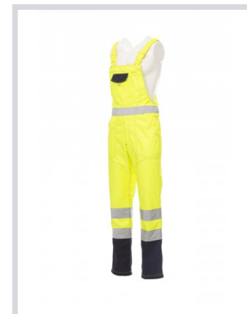
GIALLO FLUO/BLU NAVY