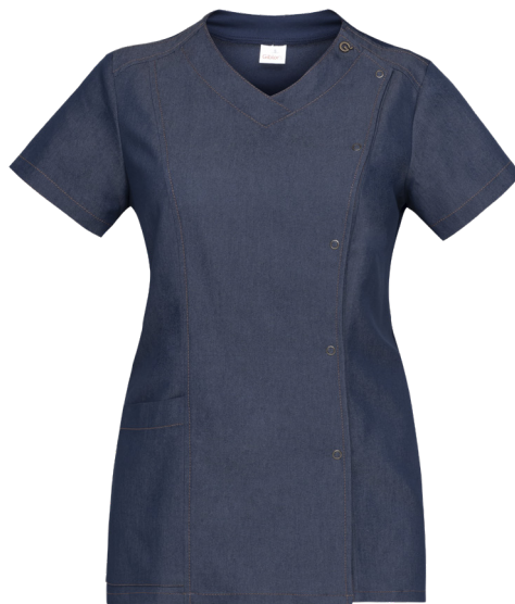
J004 Jeans blu