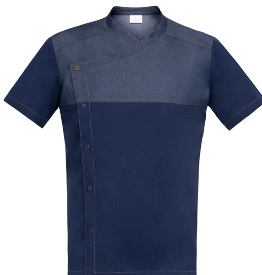
J004 Jeans blu