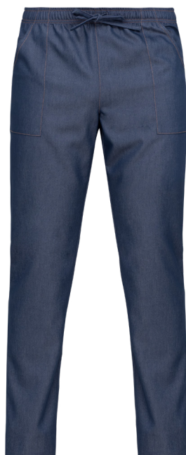
J004 Jeans blu